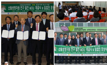
2018년 한국버섯학회... 2019-06-14 관리자