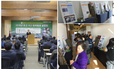
공동연구개발 산업체... 2019-06-17 관리자