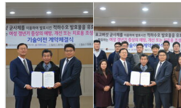
지역산업맞춤형 일자... 2019-06-14 관리자