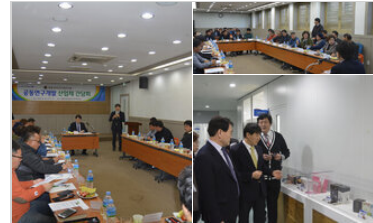
표고 원목종균 자동전... 2019-06-17 관리자