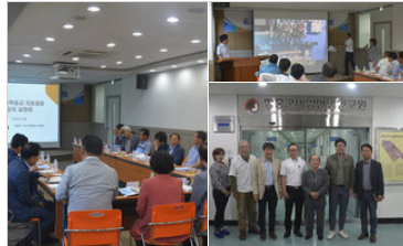
원목표고종균 자동전종양치 시연회 개최 2023-11-08 관리자