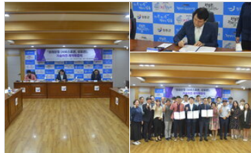
2018년 표고 국산 원 2019-06-17 관리자