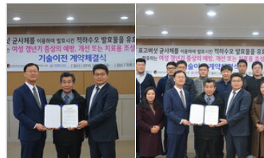
지역산업맞춤형 일자 2019-06-14 관리자