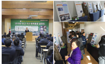
공동연구개발 산업체 2019-06-17 관리자