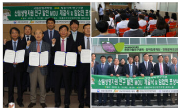
2018년 한국버섯학회 2019-06-14 관리자