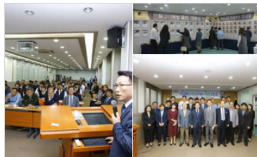
산림생명자원 연구 발 2019-06-14 관리자