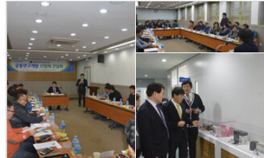
표고 원목종균 자동전 2019-06-17 관리자