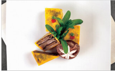
👁 111 <공유 표고 고기센드