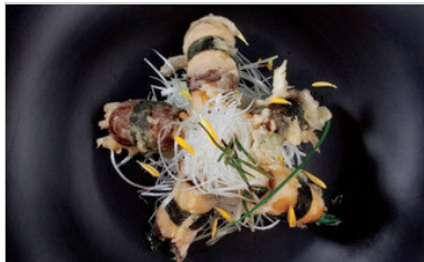
👁 76 <공유 관자를 이용한 표고 김말이 튀김