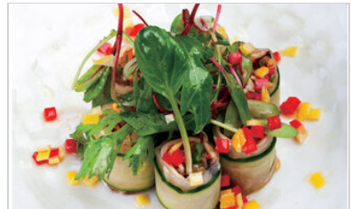
👁 88 <공유 표고 라이스페이퍼롤