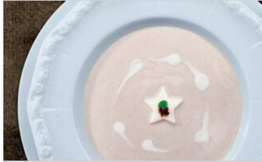
👁 82 <공유 표고 크림스프