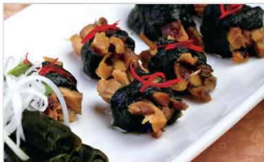
👁 84 <공유 표고 매생이냉채