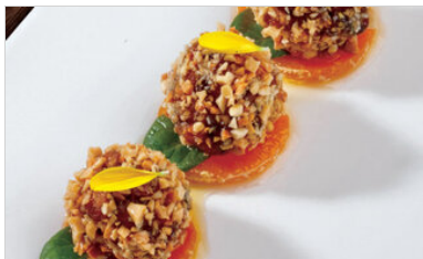
👁 71 <공유 표고 파스타