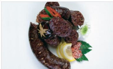
👁 72 <공유 표고 순대