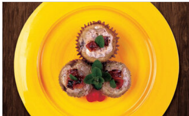
👁 109 <공유 표고 쿠키케이크