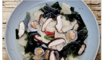
👁 74 <공유 표고 수제비