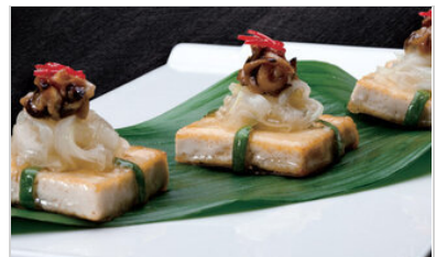
👁 82 <공유 표고 두부 카나페