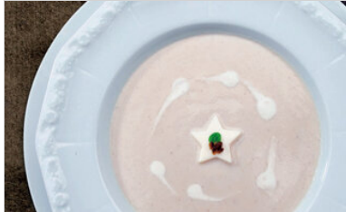
👁 82 <공유 표고 크림스프