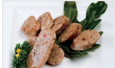
👁 88 <공유 표고 소세지