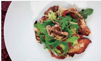
👁 85 <공유 표고 부각 샐러드