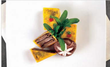
👁 111 <공유 표고 고기센드